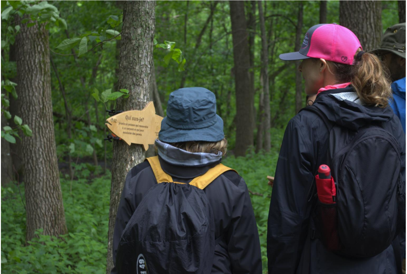
Figure 3 : Des participantes tentent de trouver la réponse à une devinette d'une station ludique.

Au fil de la randonnée l'équipe de l'OBV de la Capitale a observé que des stations ludiques tout juste installées qui se situaient sur le long du sentier principal avaient été vandalisées; les plaquettes qui recouvraient les réponses aux devinettes ont été arrachées et lancées dans les bois. Heureusement, les réparations à ces actes de vandalismes sont faciles et peu coûteuses à réaliser. Advenant la tenue d'une autre activité de randonnée animée avec rallye au Domaine de Maizerets, il serait souhaitable de ne plus placer les stations ludiques le long des sentiers principaux.