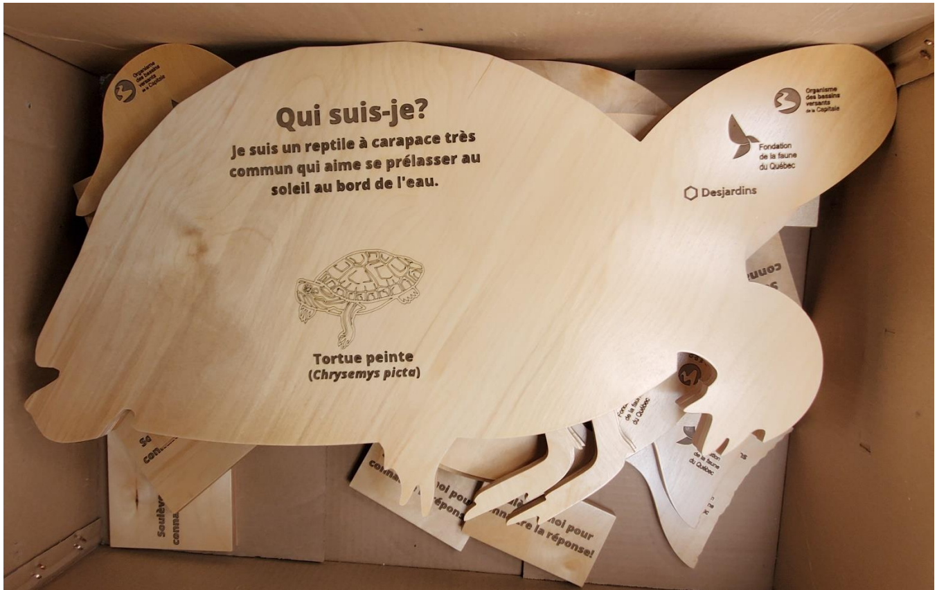
Figure 1 : Panneaux bruts tels que reçus suite au découpage, à la gravure et au vernissage par 3D coupe.