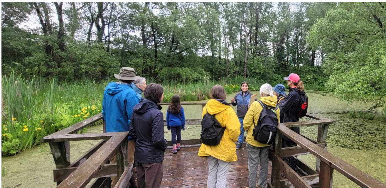
Figure 2 : Randonnée animée du 18 juin 2023, arrêt dans la portion marais du Domaine de Maizerets afin de parler de l'importance et du rôle des milieux humides ainsi que de la faune qu'ils habitent.

C'est un total de 8 personnes de tous âges qui ont participé à la randonnée (figure 2) et au rallye (figure 3).